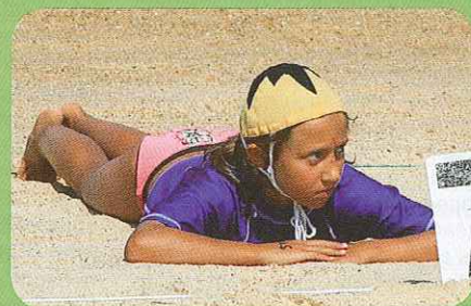
Membre du club de Sore et abonnée