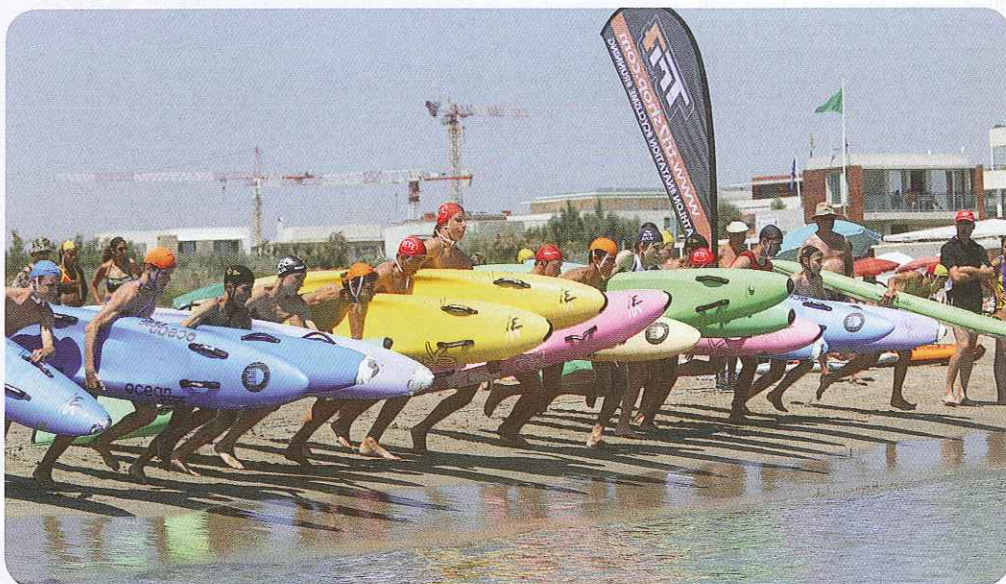
/ Rescue Cup à Sète