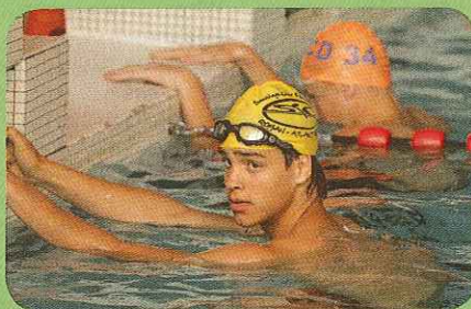
Licencié à Royan et abonné

A l'heure où la reprise a sonné, l'association Coureurs d'écume vous propose d'abonner vos licenciés à des tarifs avantageux. Les envois groupés permettent une réduction des coûts (20 € l'abonnement annuel). Les envois personnalisés reviennent à 24 € par licencié mais donnent droit, à partir du 30 ème abonné, à un encart de publicité gratuit dans le magazine.