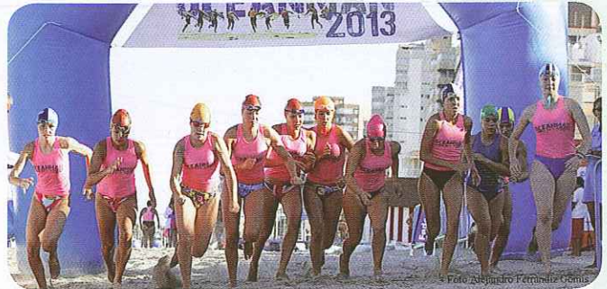
/ Round 1 in Alicante

Spanish Association Lifesaving Club is an association supported